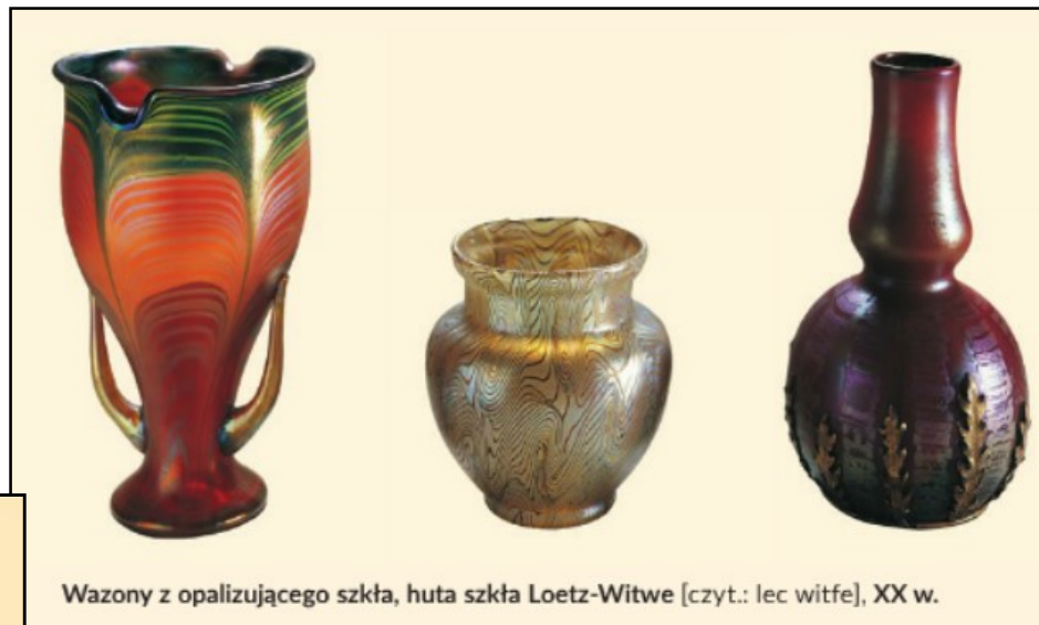
Wazony z opalizującego szkła, huta szkła Loetz-Witwe [czyt.: lec witfe], XX w.