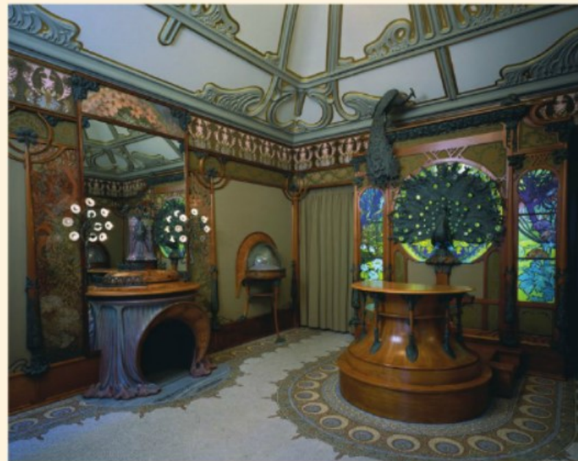
Alfons Mucha, wnętrze sklepu jubilerskiego Fouqueta [czyt.: fuketa] w Paryżu, XX w.